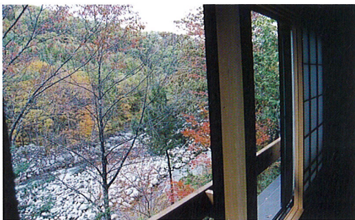
▲2Fより正沢川を見る