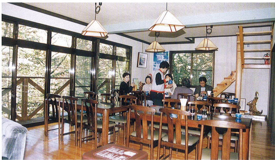
▲食事・談話コーナー