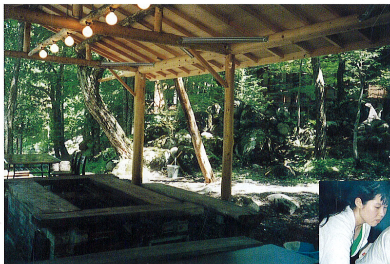
▲バーベキュー設備